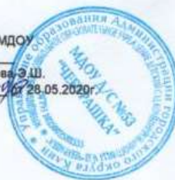
ГРАФИК выдачи пищи на летний период 2019 - 2020 учебный год