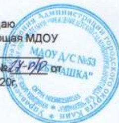
ГРАФИК выдачи пищи на летний период 2019 - 2020 учебный год